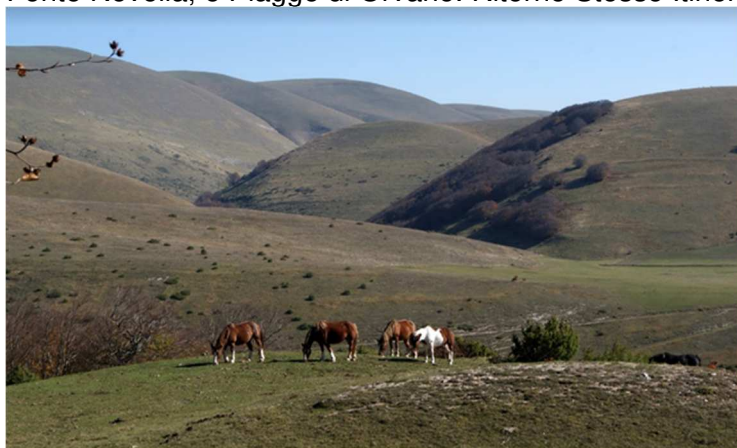
Piani della Cuna

Dal Paese di Pantaneto, Comune di Monte Cavallo, si prende la carrabile che in 3Km conduce alla località “La Forca”, qui si lascia la carrabile per una traccia di sentiero sulla sinistra, si costeggia la recinzione della Riserva del Torricchio e si esce ai Piani della Cuna e Fonte Faedo. Si prosegue su sterrata in direzione Est si svalica sotto al Colle Rotondo, si scende a Fonte Murata e per netta traccia di sentiero e picchetti sul prato si sale a Fonte Novella, e Piagge di Orvano. Ritorno Stesso Itinerario.