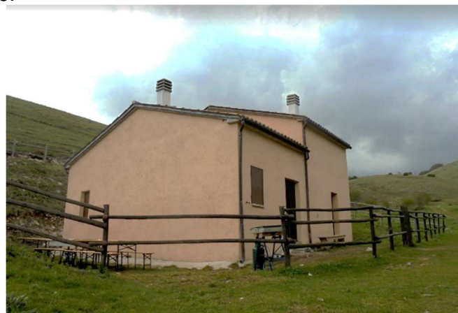
Casale delle Saliere

ISCRIZIONI: Obbligatoria iscrizione preventiva telefonando ai numeri dei direttori di escursione o al numero della sede del Cai di Macerata 0733 260704 dalle 18,30 alle 20,00 del venerdì precedente all'escursione o recarsi presso la sede stessa.